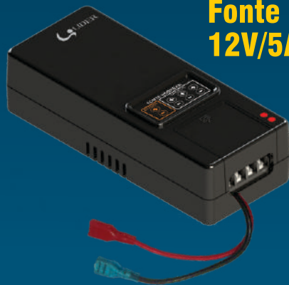
Fonte Nobreak 12V/5A