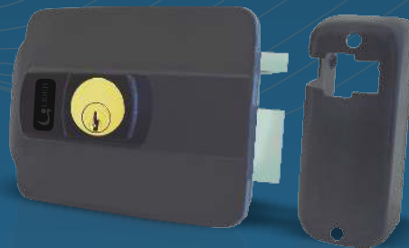
Cerradura Eléctrica LR120S Apertura interior