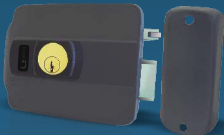
Cerradura Eléctrica LR120E Con apertura hacia el exterior