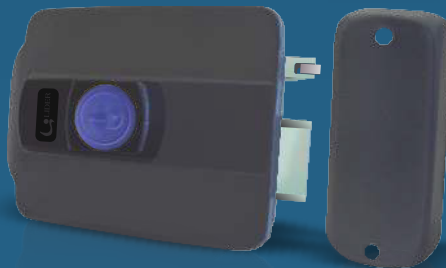
Cerradura Eléctrica Con Botón - LR121B Apertura hacia el exterior